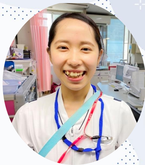
加藤病院 地域包括ケア病棟課

今後の目標は、患者様の優先順位を考え、心の声に寄り添ったケアが提供できるような看護師になることです。まだ経験が少なく技術・勉強不足の部分があり、患者様を不安にさせてしまうこともあるかと思っています。日々勉強を積み重ね、先輩の皆さんから助言をいただきながら、多くのことを吸収していきたいと思っています。