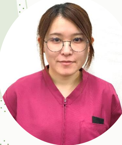
サービス付高齢者向け住宅 ナーシング&リハビリテラス 「和かち逢う家」