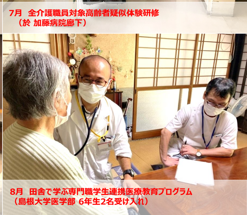
8月 田舎で学ぶ専門職学生連携医療教育プログラム (島根大学医学部 6年生2名受け入れ)