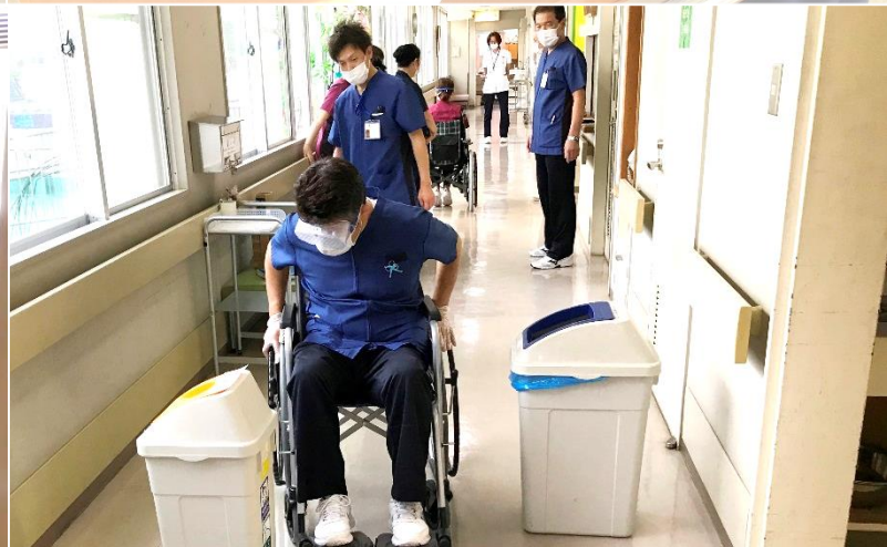
7月 全介護職員対象高齢者疑似体験研修 (於 加藤病院廊下)