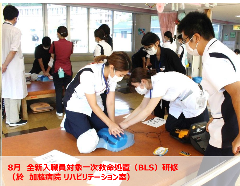
8月 全新入職員対象一次救命処置 (BLS) 研修 (於 加藤病院 リハビリテーション室)