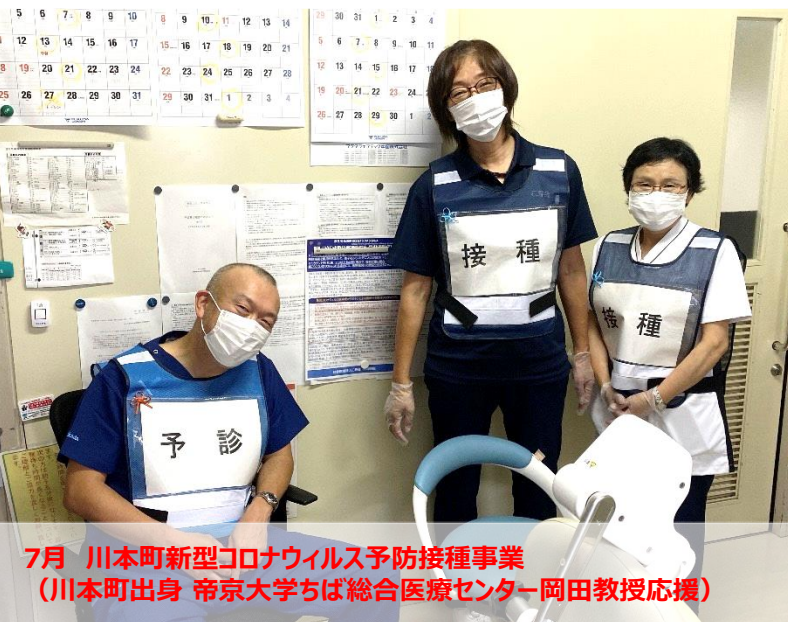
7月 川本町新型コロナウイルス予防接種事業 (川本町出身 帝京大学ちば総合医療センター岡田教授応援)

シリーズ連携 vol.13 仁寿会で働いて メディカルスタッフスキルアップセンターのご紹介