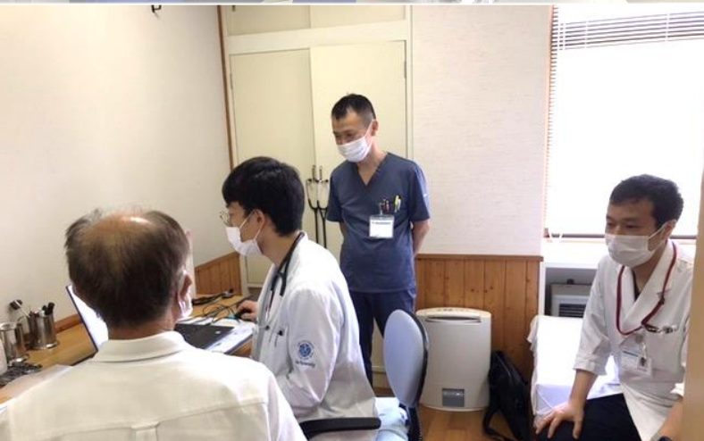
7月 田舎で学ぶ専門職連携医療教育プログラム：於 井田診療所 (東邦大学佐倉病院・大田市立病院 研修医2名受け入れ)