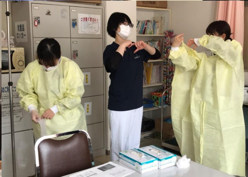
左上：令和3年度入職式、右上：辞令交付式 左・右中：新入職員オリエンテーション 左・右下：看護部新人研修